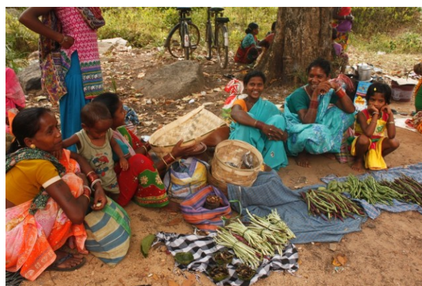
गाँव की हाट में सब्जियों की बिक्री